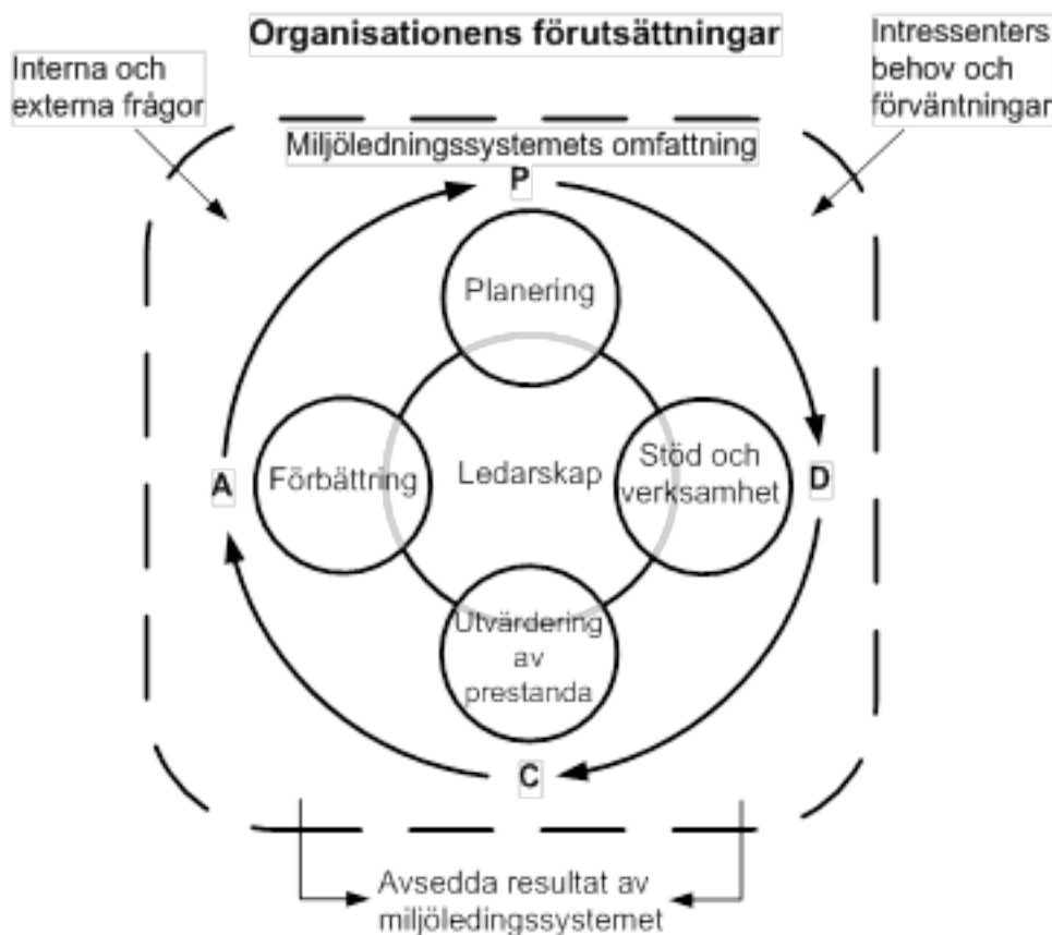
Figur 1 — Sambandet mellan PDCA och ramverket i denna standard

Figur 1 visar hur det ramverk som introduceras i denna standard skulle kunna integreras i en PDCA-modell, vilket kan underlätta för nya och befintliga användare att förstå betydelsen av ett systematiskt angreppssätt.